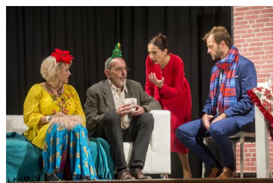
KDYŽ SE ZHASNE