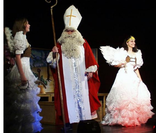
KDYŽ JE V PEKLE NEDĚLE A MIKULÁŠSKÁ NADÍLKA