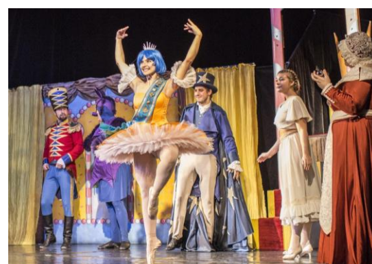
LOUSKÁČEK A BONBÓNOVÁ VÍLA